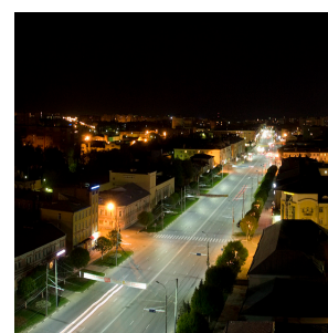
Городская автомагистраль г. Рязань 2013

Светодиоды нового поколения имеют одни из лучших на сегодняшний день показателей по соотношению лм/Вт, сроку службы и надёжности..